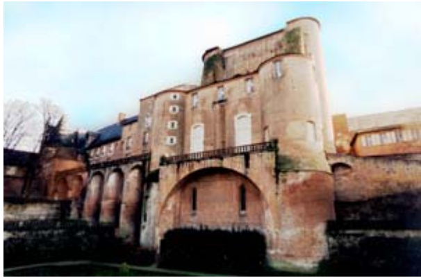
Palais de la Berbie

Le musée Toulouse-Lautrec est hébergé dans le fabuleux palais épiscopal, édifié au XIII ème siècle.