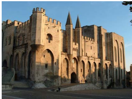
Palais des Papes à Avignon

Sept papes successifs se sont installés à Avignon au lieu de Rome - Le Palais des papes d'Avignon est aujourd'hui un monument touristique, la plus grande des constructions gothiques du Moyen Age du monde.