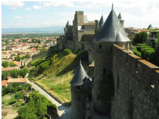
Carcassonne (France), Vue sur le château Vicomtal.

Cette cité médiévale remarquable est inscrite depuis 1997 au patrimoine mondial de l'UNESCO.