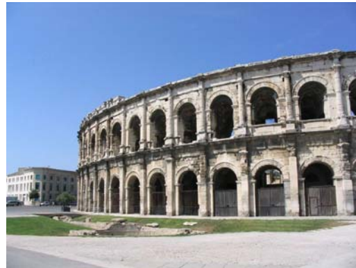
Les arènes de Nîmes