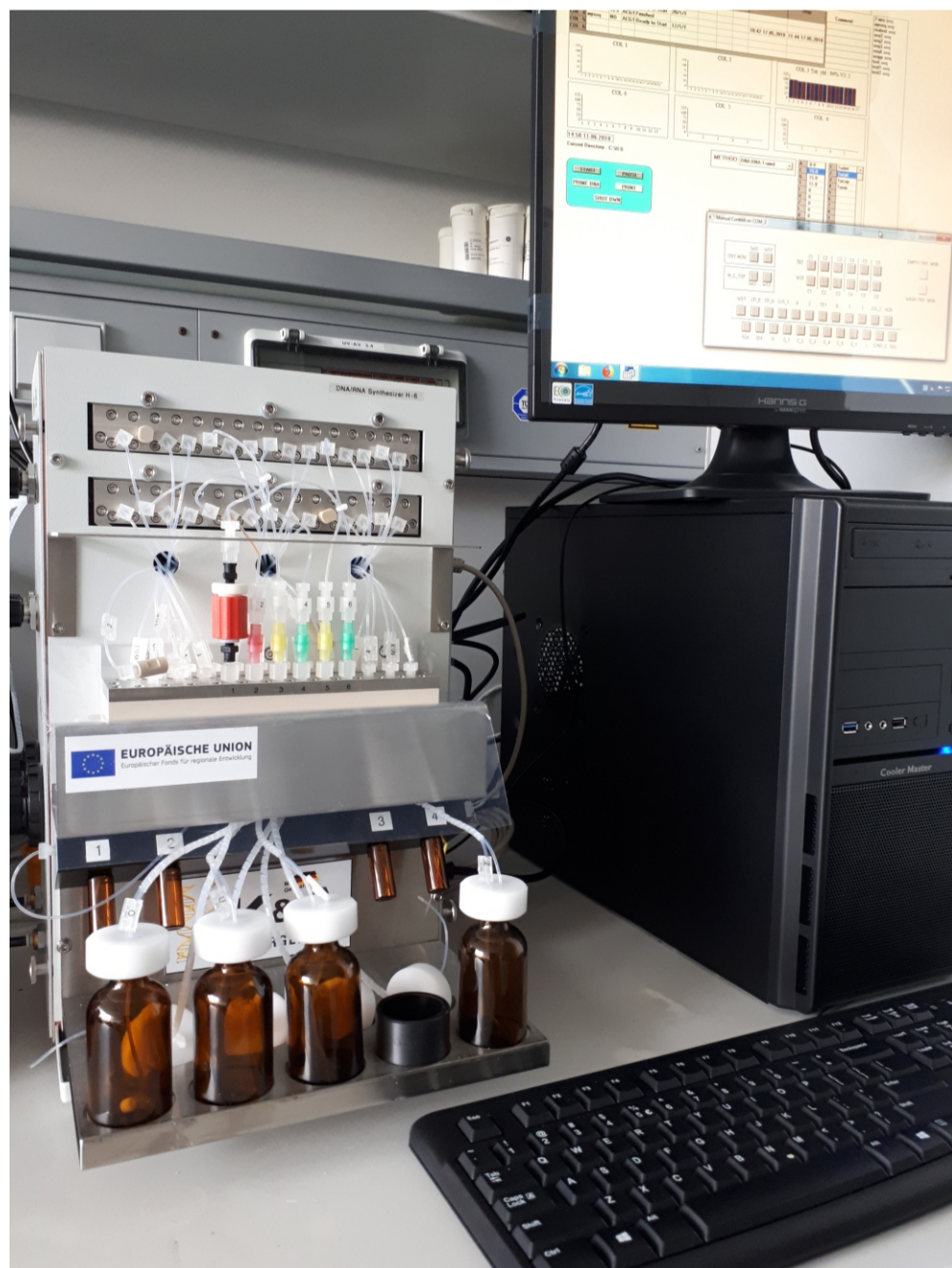
Mathematisch-Naturwissenschaftliche Fakultät Institut für Biochemie - Bioorganische Chemie Oligonucleotidsyntheseanlage AZ: GHS.17-001

Mit der Oligonucleotidsyntheseanlage H-6 können sowohl natürliche als auch modifizierte Oligonucleotide (RNA und DNA) synthetisiert werden. Es ist möglich, Oligonucleotide in einem Maßstab von 0,2 bis zu 10 µmol an verschiedenen Trägermaterialien herzustellen. Alle Reagenzienfalschen können separat angesteuert und das jeweils benötigte Volumen auf 10 µl genau eingestellt werden. Durch eine installierte Tritylmonitoring-Funktion kann der Syntheseverlauf für jeden einzelnen Kopplungsschritt verfolgt werden. Einzelne Syntheseschritte können je nach Anwendungsbedarf in Abhängigkeit von den eingesetzten Kopplungsbausteinen beliebig variiert werden, so dass je nach gewählter Oligonucleotidsequenz eine zeit- und reagenzienschonende und somit auch kosteneffiziente Synthese möglich ist.