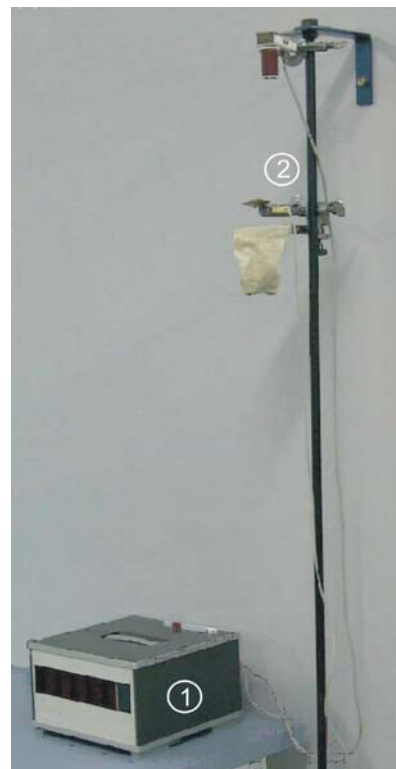
Abb. 1 Versuchszubehör.